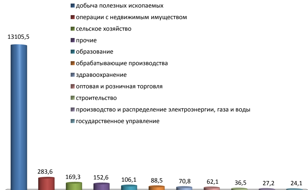
Рис. 4.1. Объем инвестиций в основной капитал по видам экономической деятельности в 2015 году (млн.рублей)

По источникам финансирования инвестиции в основной капитал по кругу крупных и средних организаций распределились следующим образом: собственные средства предприятий 13417,3 млн. рублей (95,0 % от общего объема) и привлеченные 709,0 млн. рублей (5,0 % от общего объема), из которых бюджетные средства – 598,1 млн. рублей, заемные средства других организаций – 51,8 млн. рублей, средства внебюджетных фондов – 23,9 млн.рублей, кредиты банков – 10,6 млн. рублей, инвестиции из-за рубежа – 0,3 млн. рублей, прочие - 24,1 млн.рублей.