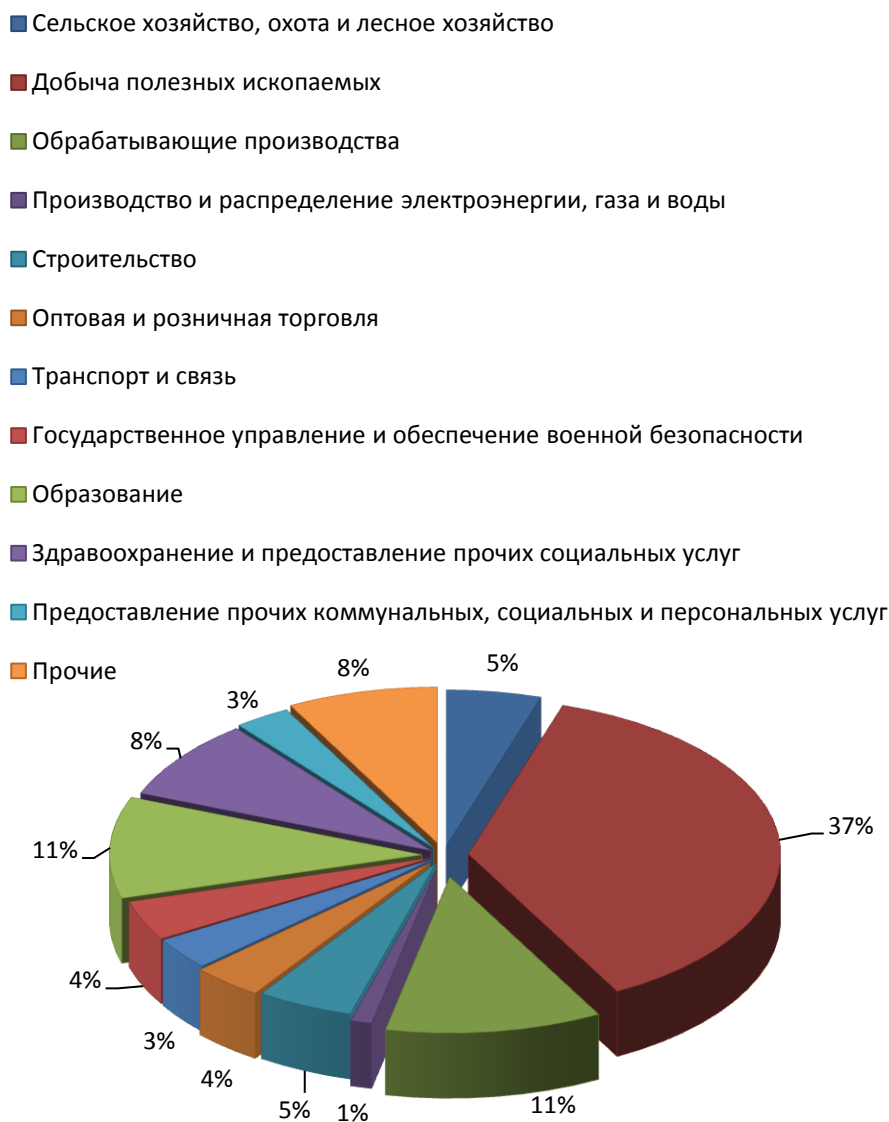
Рис. 1.2. Структура занятых по крупным и средним организациям Губкинского городского округа в 2015 году

Среднесписочная численность работающих в крупных и средних организациях Губкинского городского округа за 2015 год составила 37735 человек и уменьшилась по сравнению с 2014 годом на 298 человек.